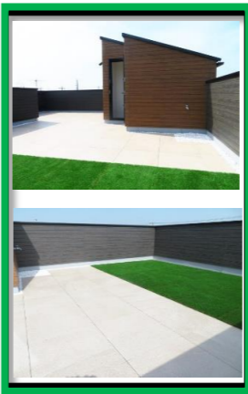
プラスワンリビング屋上庭園住宅のご案内も出来ます