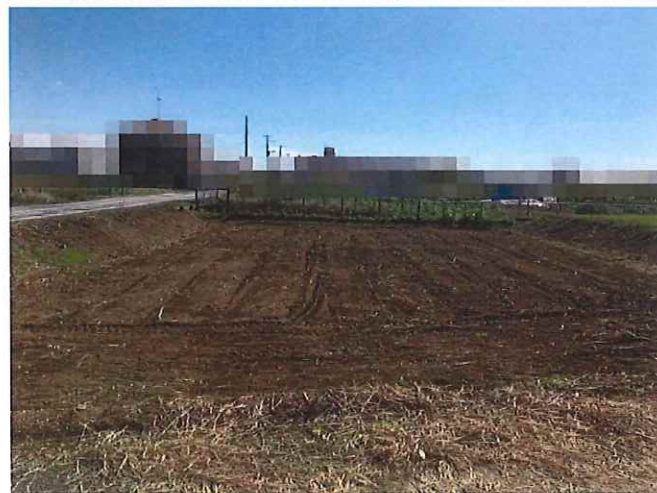
ライフインフォメーション

白岡駅.....750m(徒歩約9分) 南小学校.....300m(徒歩約4分) 南中学校.....950m(徒歩約12分) 白岡天使幼稚園.....500m(徒歩約6分)