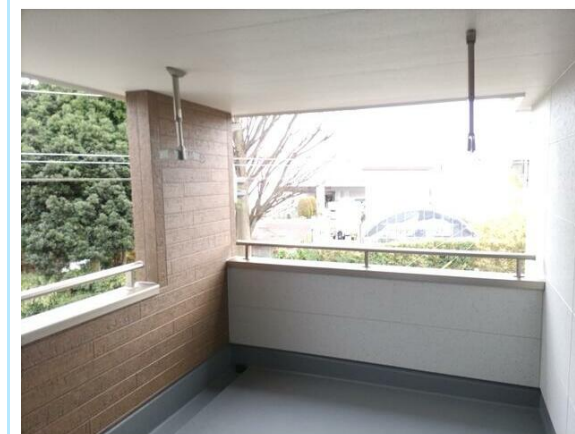
インナーバルコニー 6畳分

※この図面はATBBの物件情報の一部を抜粋して掲載しております。（現況優先）※入居日・引渡日変更や付帯条件、別途料金が発生する場合がありますのでご確認ください。