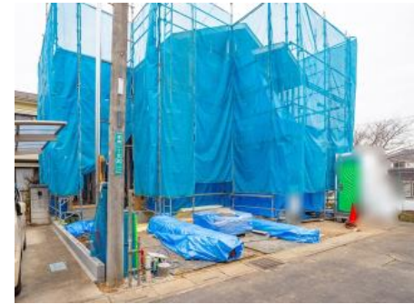
現況 (2022/01/06 撮影)