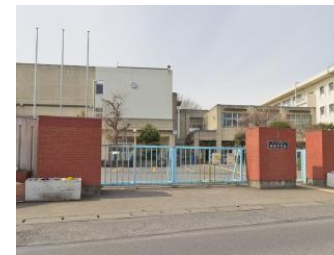
さいたま市立春里中学校 1200m