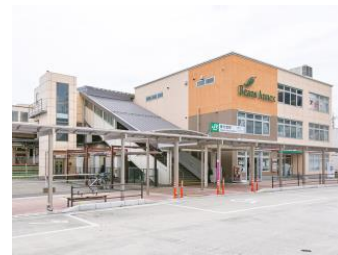
東北本線「東大宮」駅 2160m