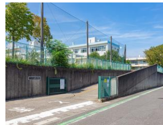
さいたま市立春岡小学校 70m